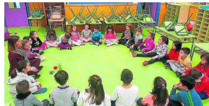
■ Los alumnos han realizado breves prácticas diarias en el aula.

llevar por ellos», añade Cuevas. Otro de los puntos fuertes del 'mindfulness' es que les hace ser más amables en todos los sentidos, lo que favorece la comprensión y combate el rechazo hacia los demás, fomentando así la tolerancia. La memoria y la atención también