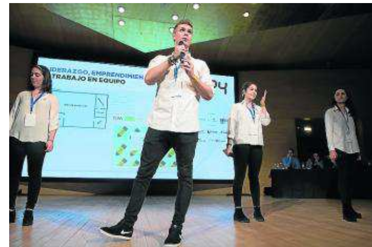
■ El equipo de Corazonistas-La Mina, en plena presentación de 'Tewi'.

Pero 'Tewi' también es el proyecto, el sueño, de un grupo de alumnos de 2º de bachillerato del Colegio Sagrado Corazón-La Mina de Zaragoza preocupados por el derroche de papel que hacemos a diario, por el elevado coste de los libros de texto y del material escolar, y convencidos de que podemos prolongar la vida útil de las cosas y tratar a nuestro maltrecho medio ambiente como se merece. Y compromiso, creatividad e innovación son los valores que el jurado supo descubrir en este joven equipo de alumnos a la hora de elegir su proyecto como ganador en la III Jornada de Liderazgo, Emprendimiento y Trabajo en Equi-